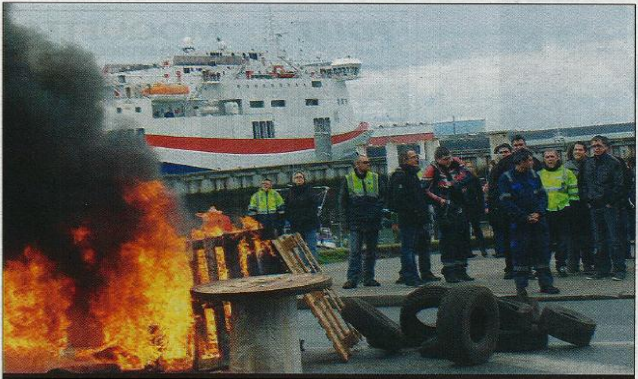
Feu de palettes et de pneus aux abords du siège du Grand port maritime du Havre