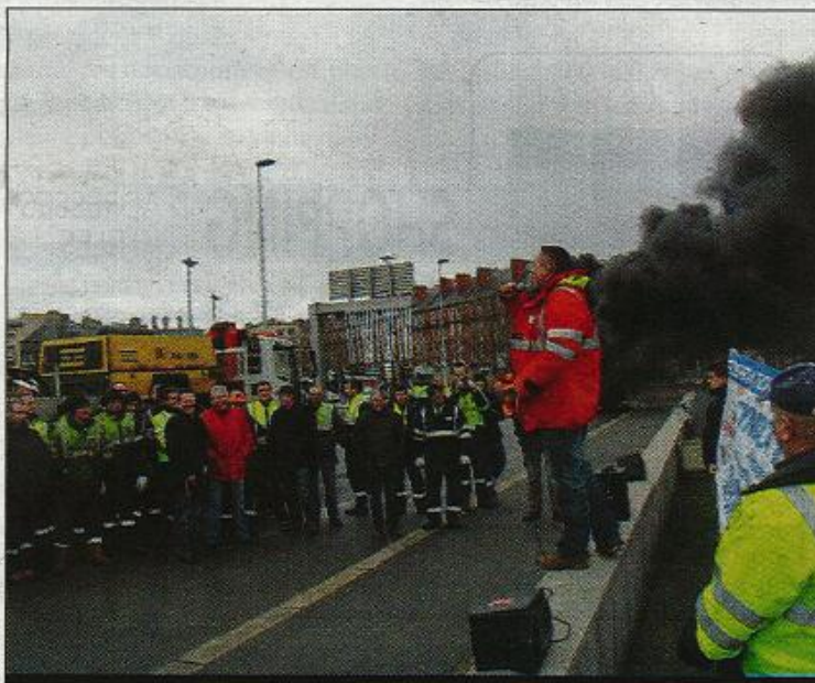
Ce sont les personnels techniques qui ont majoritairement fait grève

« Cinquante réunions au cours du second semestre 2012, 20 depuis le début de l'année ». De son côté, la direction insiste sur sa volonté de privilégier la négociation. « Nous sommes dans une relation sociale normale propre aux entreprises. Les discussions se poursuivent. L'ensemble des points est abordé et travaillé. Il y a une volonté d'échange pour aboutir à la meilleure solution dans une discussion globale ». Cette volonté prononcée de négocier semble s'imposer d'autant plus dans un contexte qui pourrait se durcir avec d'autres sujets « chauds » (maintenance, Haropa, effectifs).