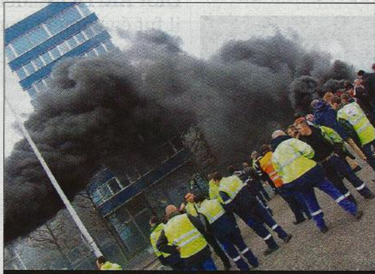
Un panache de fumée au pied du GPMH, une image presque oubliée

« Nous ne sommes pas entendus sur nos revendications qui sont pourtant légitimes. Nous demandons l'application de la revalorisation salariale dans le cadre des