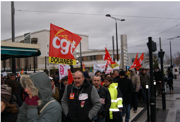
Au Havre, 1000 manifestants

Sur les 130 rassemblements et manifestations recensés sur tout le territoire, c'est plus de 150.000 personnes qui sont descendues dans les rues dire leurs légitimes exigences et leur fort mécontentement, notamment sur les salaires, l'emploi public, le jour de carence. « Les fonctionnaires ont de nouveau exprimé leur volonté qu'une autre politique soit mise en œuvre et que des mesures urgentes soient prises », soulignent les trois organisations syndicales dans un communiqué commun. Elles « se félicitent du succès de cette initiative » et attendent que « la ministre entende le message délivré et, à l'occasion du rendez-vous du 7 février, qu'elle apporte de véritables réponses aux questions posées. Dans le cas contraire, nos organisations syndicales, dans l'unité la plus large possible, prendront de nouveau leurs responsabilités et appelleront à poursuivre et à développer la mobilisation. »